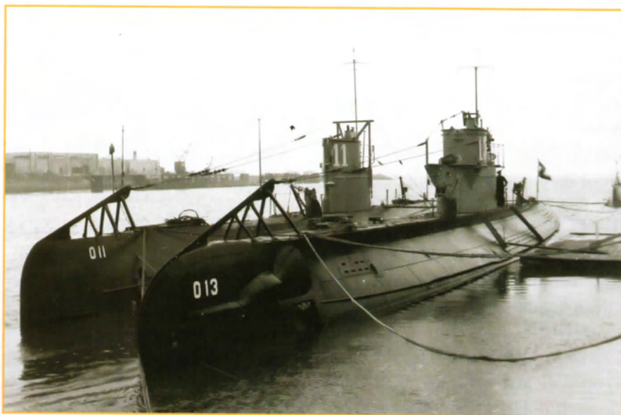
Hr.Ms. O13, sinds 19 juni 1940 met 34 man aan boord vermist op de Noordzee.

Vanaf 29 mei maakte de O13 vanuit Portsmouth haar eerste oorlogspatrouille in het Engelse Kanaal. Zij moest helpen de schepen te beschermen die bezig waren het Britse expeditieleger uit Duinkerken naar Bordeaux te evacueren. Vlak onder de Franse kust ontmoette de O13 de U9. Dit was het eerste contact van een Nederlandse onderzeeboot met een Duitse. Tot een vuurgevecht