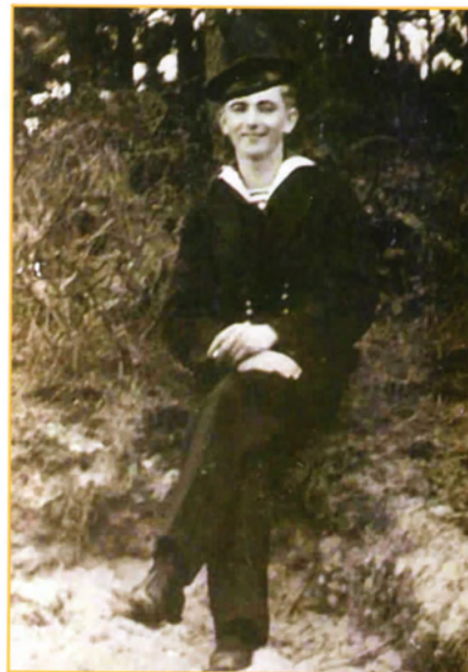
Lo Laan wilde na het ongeluk met de O11 zijn contract met de marine verbreken.

Hr.Ms. O13, gebouwd in 1928, lag sinds 29 augustus 1939 in de thuishaven voor groot onderhoud. In april 1940 was ze weer vaarklaar. Wegens de oorlogsdreiging besloot de chef van de marinestaf, vice-admiraal J.Th. Fürstner, op 9 mei 1940 de marine in de hoogste staat van paraatheid te brengen. Toen er 's avonds berichten uit Berlijn